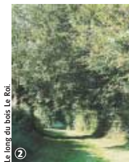
Le long du bois Le Roi.

Au départ du charmant village de Beaufort, découvrez la lisière de la Haie d'Avesnes, relique de l'ancienne forêt celté. En période de pluie, le port de chaussures étanches s'avère nécessaire.