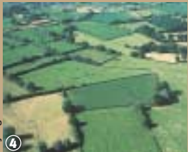
Paysage de l'Avesnois.

1940, pour barrer la route aux Allemands. Ils coulent désormais des jours paisibles bien mérités sous l'œil respectueux des promeneurs.