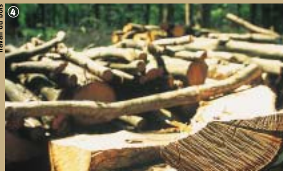
Travail du bois

Le musée des bois jolis de Felleries ainsi que des ateliers d'artistes vous ouvrent leurs portes et vous invitent à découvrir bois tournés, à Leval et à Felleries, ébénisterie et antiquités à Bersillies, sculpture à Recquignies, dans la douce odeur du bois qui se métamorphose, sans oublier le facteur d'orgues de Berlaimont ! Laissez-vous séduire par le savoir-faire, l'ingéniosité de l'outil, la beauté et la magie des gestes, qui avaient, et ont encore en commun, d'être faits avec ardeur et courage, donnant ainsi tout son sens à l'expression du bel ouvrage.