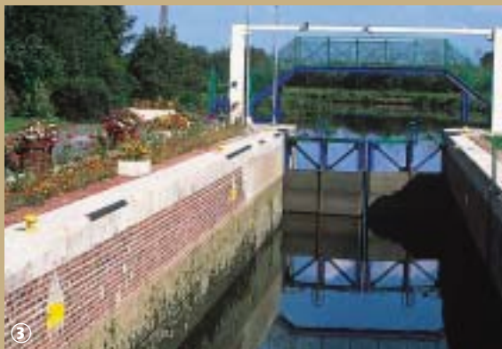
Ecluse de Sassegnies

L'Avesnois est un territoire où les ressources naturelles sont aussi visibles dans l'architecture que dans l'activité des hommes. Héritiers d'un savoir-faire légué par tradition et par des générations d'artisans, ses habitants ont su extraire le meilleur des matériaux naturels, en développant des talents et des métiers. De multiples espaces forestiers y sont répartis et, en l'occurrence, la forêt la plus importante du département : la forêt de Mormal.