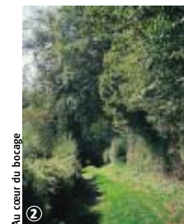
Au cœur du bocage

Ce circuit relie la Sambre champêtre à la forêt domaniale de Mormal et traverse entre deux la ceinture bocagère. Elle emprunte donc divers chemins et routes et traverse un paysage varié. Le patrimoine naturel et fluvial anime une grande partie du parcours.