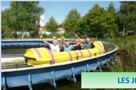
LES JEUNES EN VOYAGE