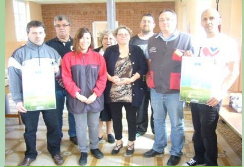
COLLECTE DE LAIT DE SAINT VINCENT DE PAUL