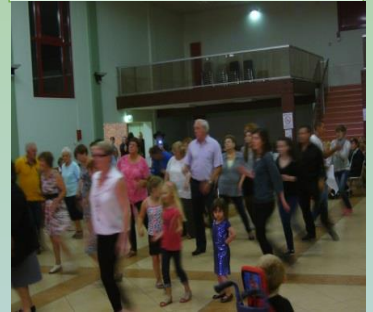
LE BAL DU 14 JUILLET