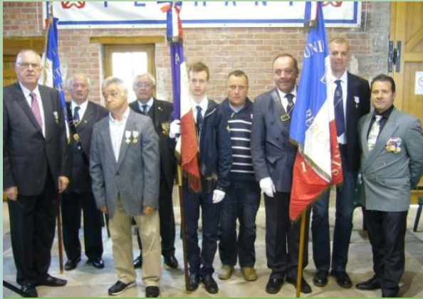
LA COMMEMORATION DU 08 MAI