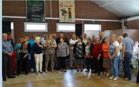
LE VOYAGE DES AÎNES