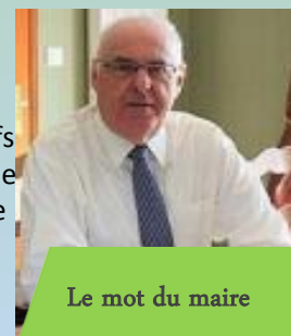
Le mot du maire