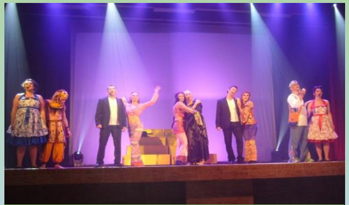
LA COMEDIE MUSICALE SUCCESS CITY