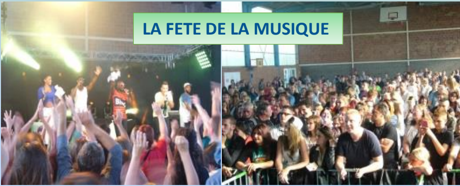
LA FETE DE LA MUSIQUE