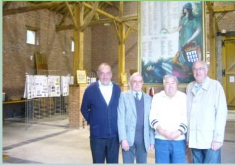
EXPOSITION SOUVENIR DE LA GUERRE 14 - 18