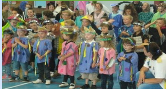
L'ASSOCIATION ELA A LA DUCASSE DU SARS BARA