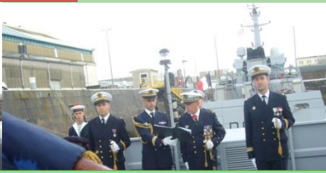
LE COLLEGE GILLES DE CHIN SUR LE FLAMANT POUR LA PRISE DE COMMANDEMENT