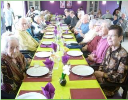
LA FETE DES VOISINS A LA RESIDENCE REINE DES PRES