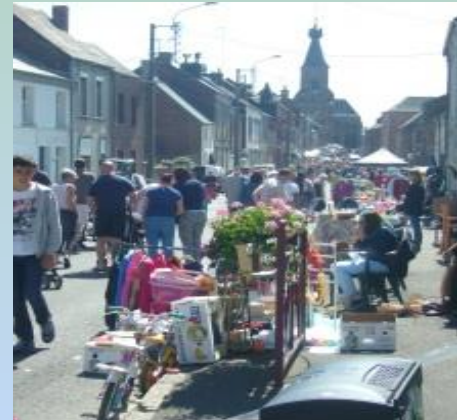
LE VIDE GRENIER DU CLUB DES CYCLOTOURISTES