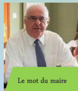
Le mot du maire

Comme vous le voyez, le travail ne manque pas et les difficultés non plus ! Nous les aborderons avec votre aide et votre confiance, toutes sensibilités confondues.