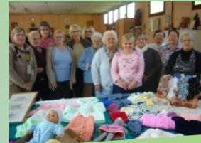
Portes ouvertes du club de l'amitié