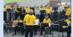
Chorale « A corps et à chœur »: Cap au nord pour le chœur breton Libenter