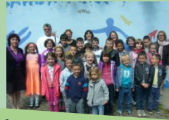
Saint Vincent de Paul: Repas de partage des enfants