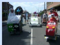
CORTEGE DU BOUZOUÇ