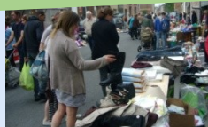
Brocante du club cyclotouristes