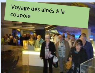
Voyage des aînés à la coupole