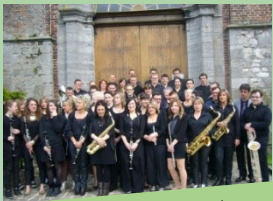
Concert de printemps de l'harmonie municipale