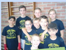
Deuxième championnat de France de boxe Thaï