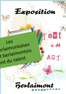
Les berlaimontoises et berlaimontois ont du talent