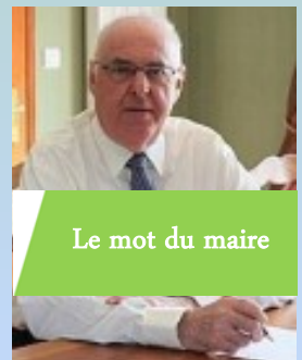
Le mot du maire