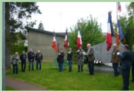
60ème anniversaire de la fin de conflit d'Indochine et de la bataille de Dien Bien Phu (1954 - 2014)